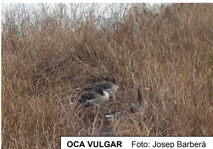
OCA VULGAR

Bec de corall estrilda astrild : Aquest mes s'han pogut observar un gran nombre d'individus sobretot a final de mes, fins a 125 el dia 5 (DCFA, XRCA) a final de mes has desaparegut, el dia 25 se'n va veure 1 (DCFA) i des de llavors no s'han vist més.