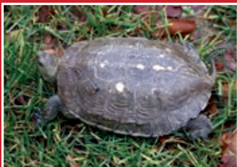
Mauremys leprosa (Galápago leproso)

Su coloración varía entre marrón a verde negruzco con puntos o rayas amarillas. Alcanza 20 cm de longitud. Viven en regatas y embalses con fondo limoso y preferentemente con vegetación.